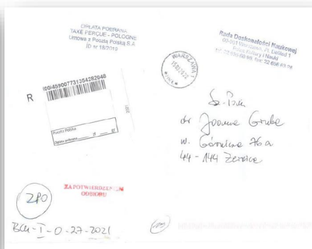
Rysunek 1. Koperta przesyłki poleconej, w której przesłano postanowienie RDN z 22 grudnia 2021 r. o odmowie zawieszenia postępowania.

W załączeniu przedłożono skany pierwszej stron: postanowienia z 22 grudnia 2021 r. o odmowie zawieszenia postępowania oraz zaskarżanej decyzji z 22 grudnia 2021 r. o odmowie nadania stopnia naukowego, a ponadto: skan koperty przesyłki poleconej o nr 00459007731354282048 (postanowienie o odmowie zawieszenia postępowania), skan koperty przesyłki poleconej o nr 00459007731354282000 (zaskarżona decyzja o odmowie nadania stopnia naukowego), jak również wydruk informacji ze strony Poczty Polskiej, dotyczących ww. przesyłek poleconych.