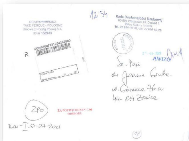
Rysunek 2. Koperta przesyłki poleconej, w której przesłano zaskarżaną decyzję RDN z 22 grudnia 2021 r.